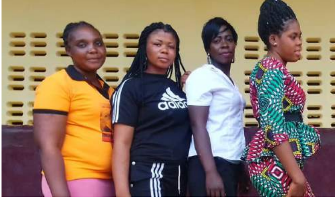
Suite aux 2 nouveaux blocs construits de 6 salles....

Marist' Jean Claude Colin school in Voundou: In addition to the Francophone section, this year we started the school on September 4th with an Anglophone section with 60 pupils from kindergarten to class 4.